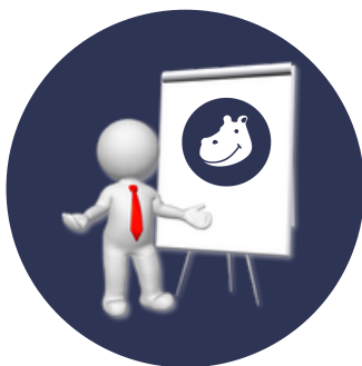
Aide à la décision