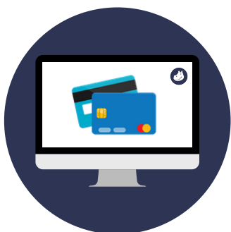
Paiement en ligne