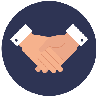
Gestion de la relation client